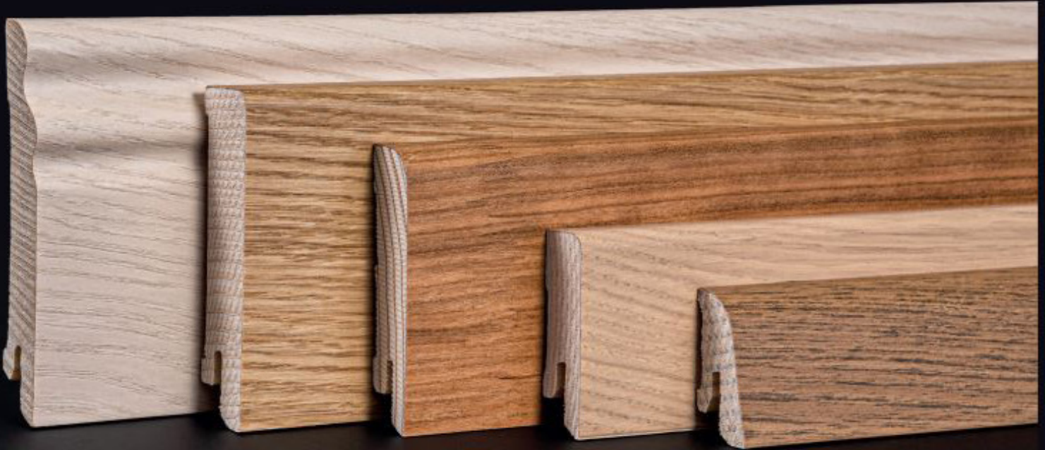
Furnierummantelte Profile auf Fichtenträger

Hergestellt mit Leidenschaft - In 65 Jahren haben unsere Mitarbeiter:innen uns zu dem gemacht was wir heute sind – ein erfolgreiches und gesundes Unternehmen.