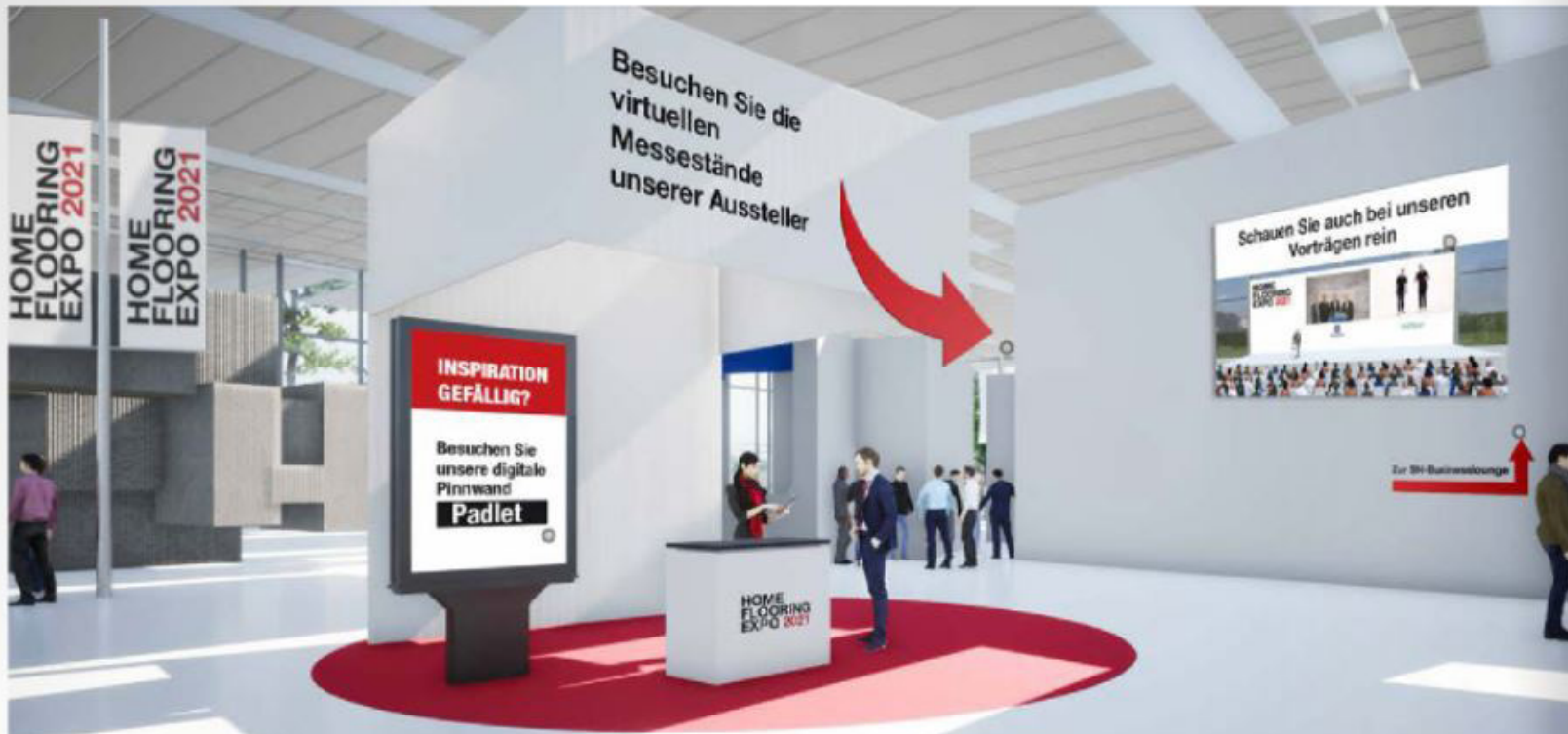
Über diese Lobby gelangten die Besucher zu den einzelnen Bereichen der Home & Flooring Expo 2021: den Ständen, den Vorträgen, der „Wall of Inspiration“ und der SN-Home-Businesslounge.

Home & Flooring Expo 2021: Veranstalter zieht positive Bilanz